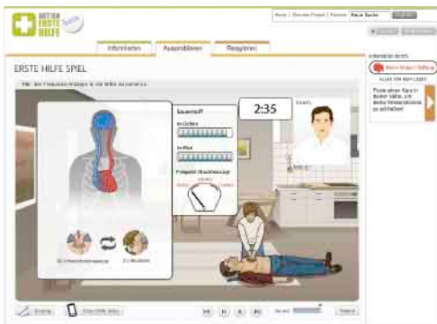
Online-Spiel auf www.aktion-erste-hilfe.de

2009 haben sich sechs ausgewählte Teams auf das „Abenteuer Gründung“ eingelassen: