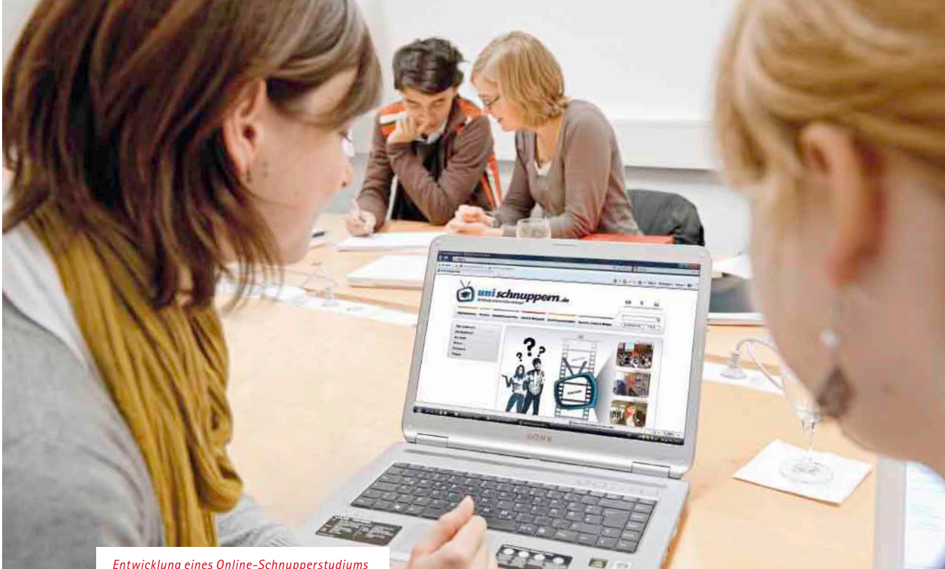
Entwicklung eines Online-Schnupperstudiums durch das Kölner Projektteam