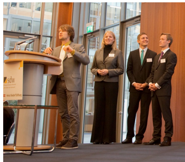
Präsentation der Stiftung Elemente der Begeisterung auf dem 5. Abschlusskongress »Herausforderung Unternehmertum« der Stiftung der Deutschen Wirtschaft und der Heinz Nixdorf Stiftung in Berlin am 4. Dezember 2009.

Unterschiedliche Beweggründe führen zu einer Stiftungsgründung. Häufig entscheiden sich etablierte Unternehmen und Privatpersonen, stiftend Gutes für das Gemeinwohl zu tun. Bislang wagen nur sehr selten junge