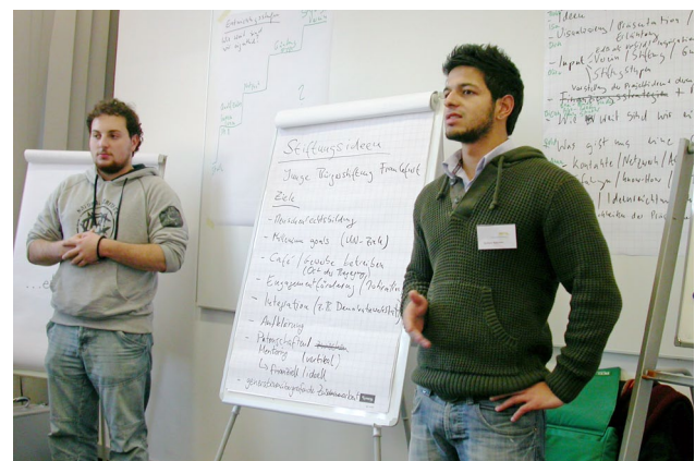
Teilnehmer präsentieren ihre Gründungsidee. Der dreitägige Workshop Jugend stiftet! fand in Kooperation mit der Stiftung Polytechnische Gesellschaft im Oktober 2010 in Frankfurt am Main statt.

Das Projekt Jugend stiftet! realisiert sich mit starken Kooperationspartnern. Eine Auflistung der bisherigen Stationen finden Sie im folgenden Abschnitt.