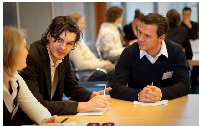
Gespräche mit interessierten Stipendiaten der Stiftung der Deutschen Wirtschaft nach der Präsentation am 4. Dezember 2009 in Berlin.

Die Teilnehmer haben sich bereits durch gemeinnütziges Engagement ausgezeichnet und zeigen ernsthaftes Interesse an der Gründung einer Stiftung zur Lösung gesellschaftlicher Aufgaben.